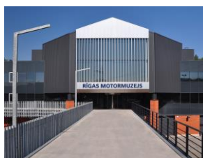
Múzeum automobilov zvonku a zvnútra