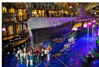
zvnútra hangáru, expozície