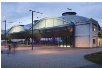
Námorné múzeum zvonka

Raňajky, prehliadka mesta Tallin , výstup na najvyššiu vežu, kde sa nachádza Národné múzeum, prehliadka historickou časťou mesta. Odchod do mesta Riga – príchod v podvečerných hodinách. Nocľah v hoteli NB hotel *** bez večere.